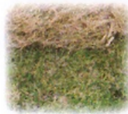
Nupjautą pavytusią žolę